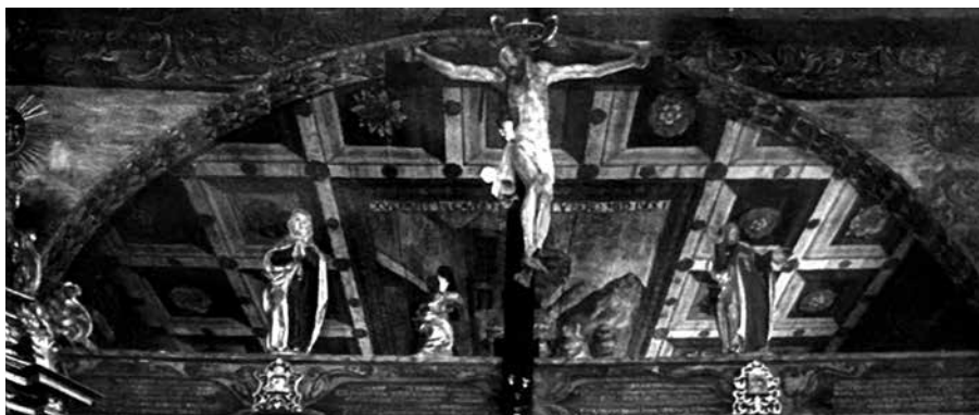
Scena Ukrzyżowania na belce tęczęwej - Orawka